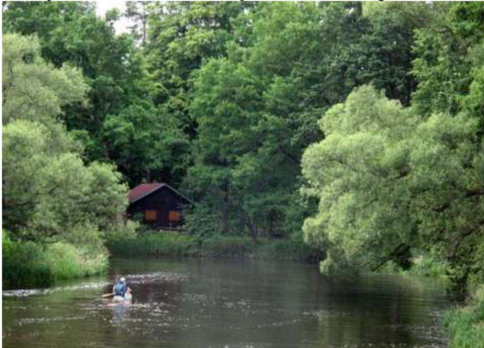
Nežárka je pohodová řeka