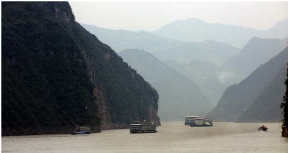
Tři soutěsky na Yankceů; před vybudováním velké přehrady byla hladina hluboce zakleslá v údolí