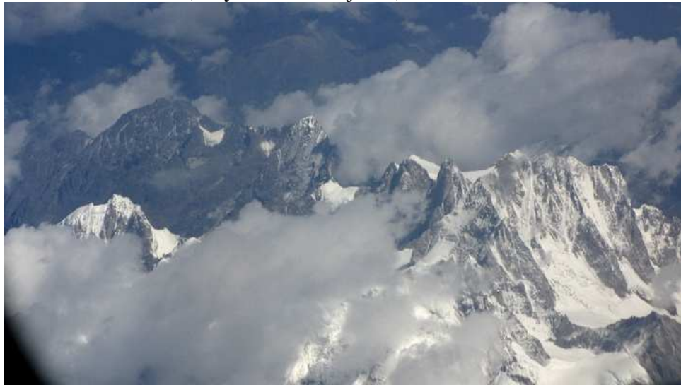
Pohled na Himaláj z Lhasi