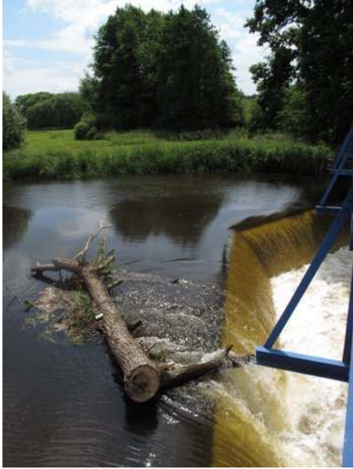
Hamr – Konec plavby