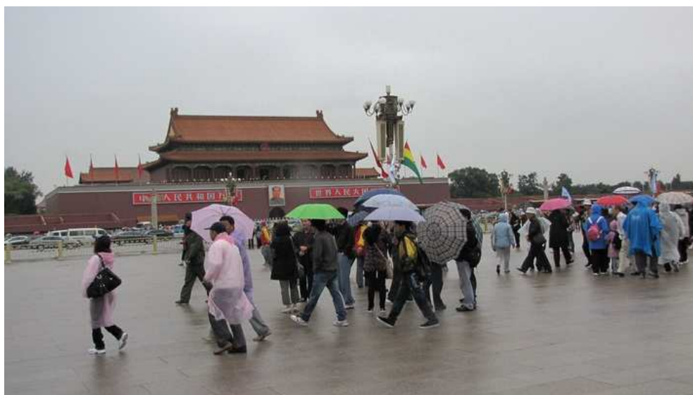
Tian'anmen v Beijingu (náměstí, kde byl ten masakr)