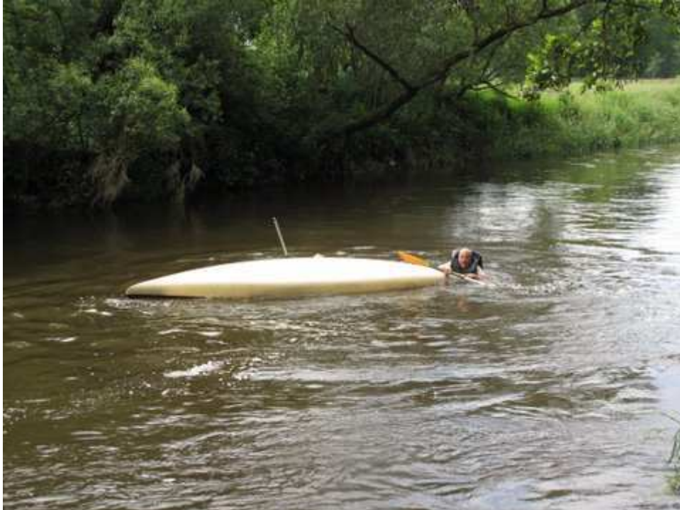
Ovšem pro některé i tento tok skýtá příležitost k dobrodružství