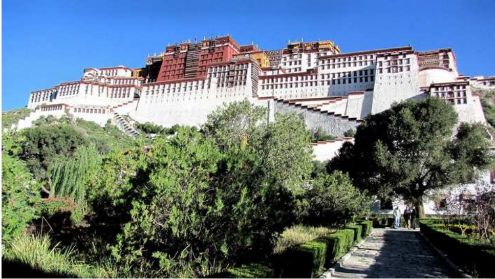
Palác Patela, kdysi sídlo Dalajlami, dnes turistická atrakce

Tohle před nepokoji v Tibetu v Lhase nebylo