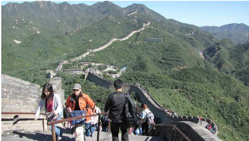
Velká čínská zeď